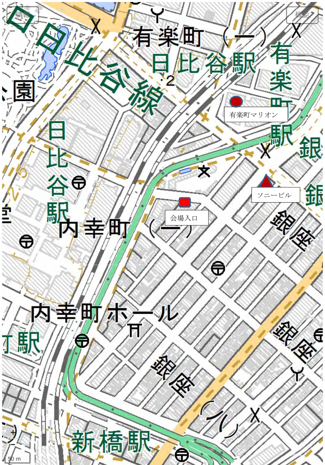
別の地図 会場付近 地下道などが無視されている地図