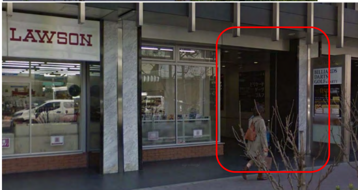
以上は 2016 年のグーグルストリートビュー