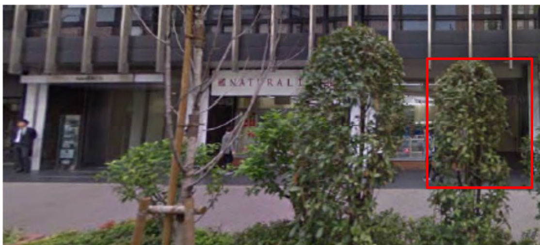
2017 年 10 月のストリートビュー